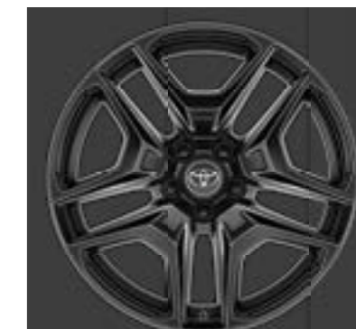
Ζάντες αλουμινίου 19" GR SPORT glossy μαύρο (5 διπλών ακτίνων) Βασικός εξοπλισμός στην έκδοση GR SPORT