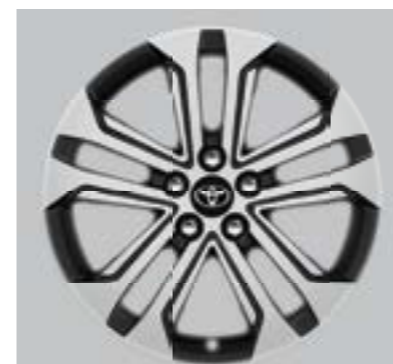
Ζάντες αλουμινίου 18" machined-face (5 διπλές ακτίνες) Προαιρετικά σε όλες τις εκδόσεις