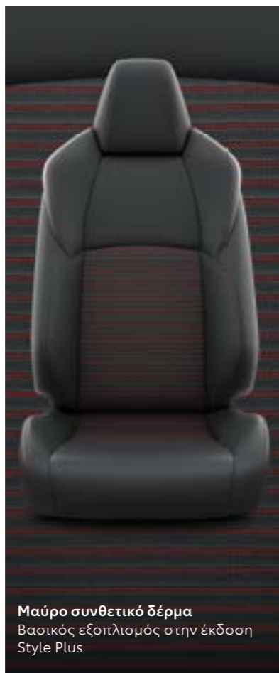
Μαύρο συνθετικό δέρμα Βασικός εξοπλισμός στην έκδοση Style Plus