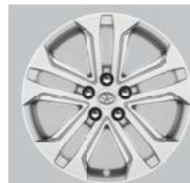
Ζάντες αλουμινίου 18" ασημί Προαιρετικά σε όλες τις εκδόσεις