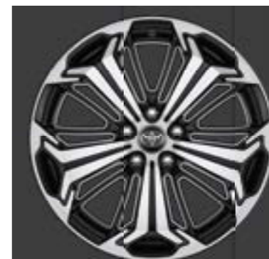
Ζάντες αλουμινίου 19" machined-face (5 ακτίνων) Βασικός εξοπλισμός στις εκδόσεις Style Plus και Black Edition