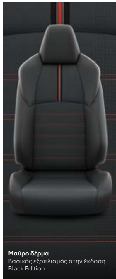
Μαύρο δέρμα Βασικός εξοπλισμός στην έκδοση Black Edition