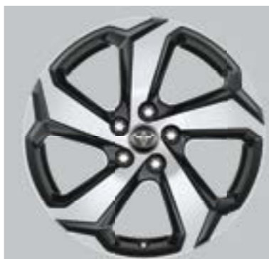
Ζάντες αλουμινίου 18" γκρι (5 ακτίνων) Βασικός εξοπλισμός στις εκδόσεις Active Plus και Style