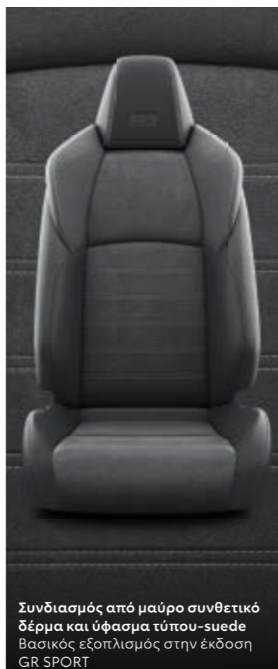
Συνδιασμός από μαύρο συνθετικό δέρμα και ύφασμα τύπου-suede Βασικός εξοπλισμός στην έκδοση GR SPORT