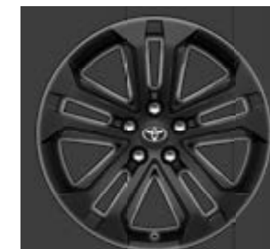
Ζάντες αλουμινίου 18" σε μαύρο χρώμα ματ Προαιρετικά σε όλες τις εκδόσεις