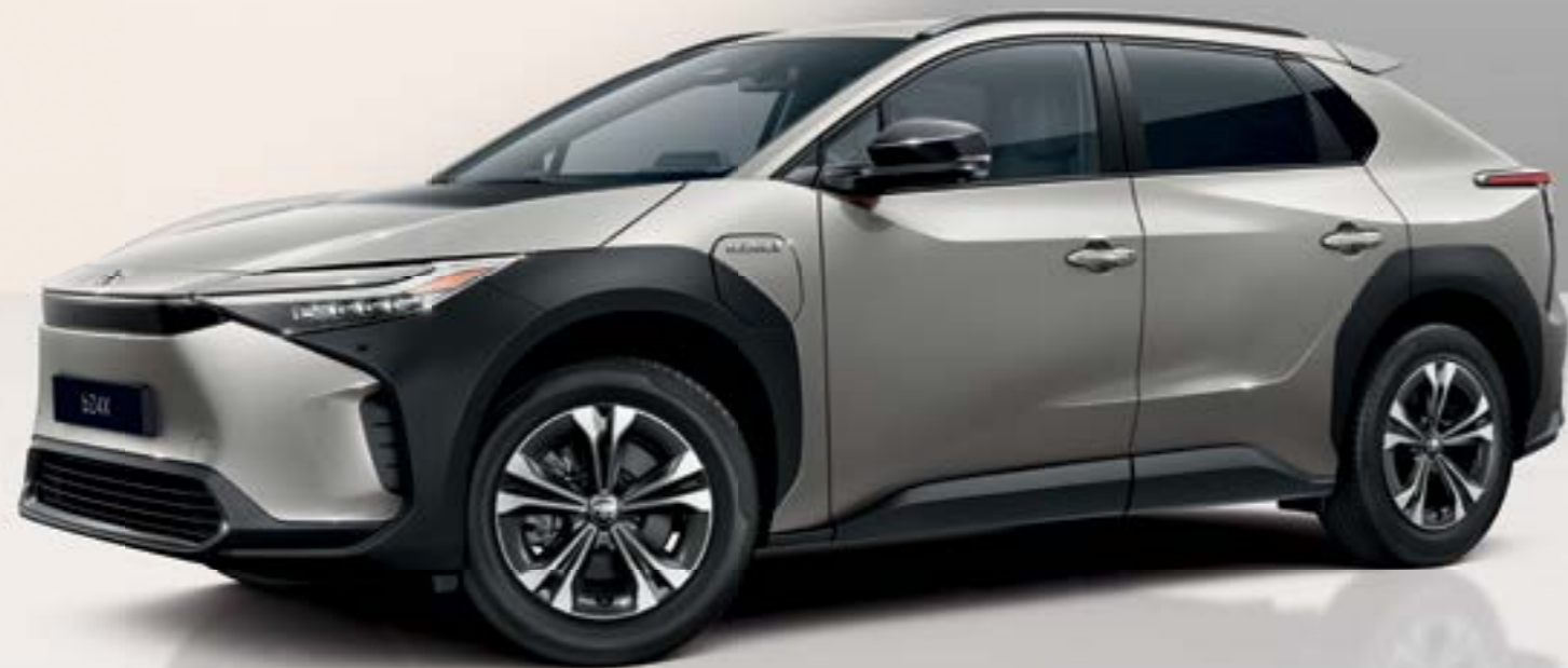
Η έκδοση που απεικονίζεται είναι η Style